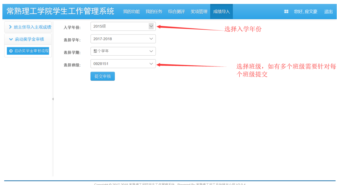
图 2-5 提交综测审批 workflow